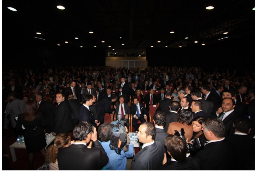
Kültür ve Turizm Bakanı Sayın Ertuğrul GÜNAY 'ın Katılımı İle Gerçekleşen Açılış Töreni