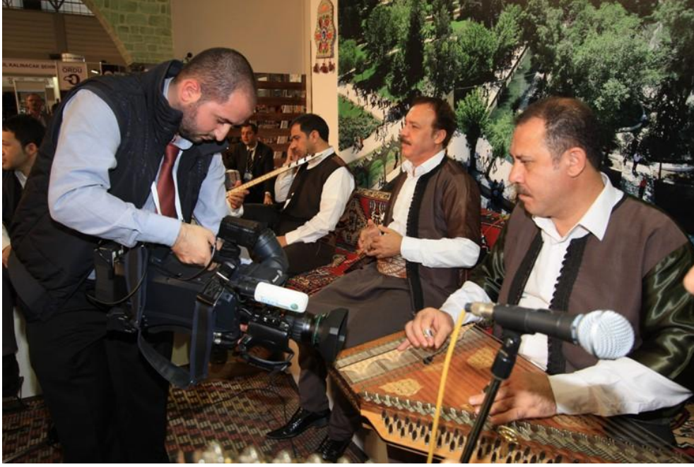
World Travel Çekimleri