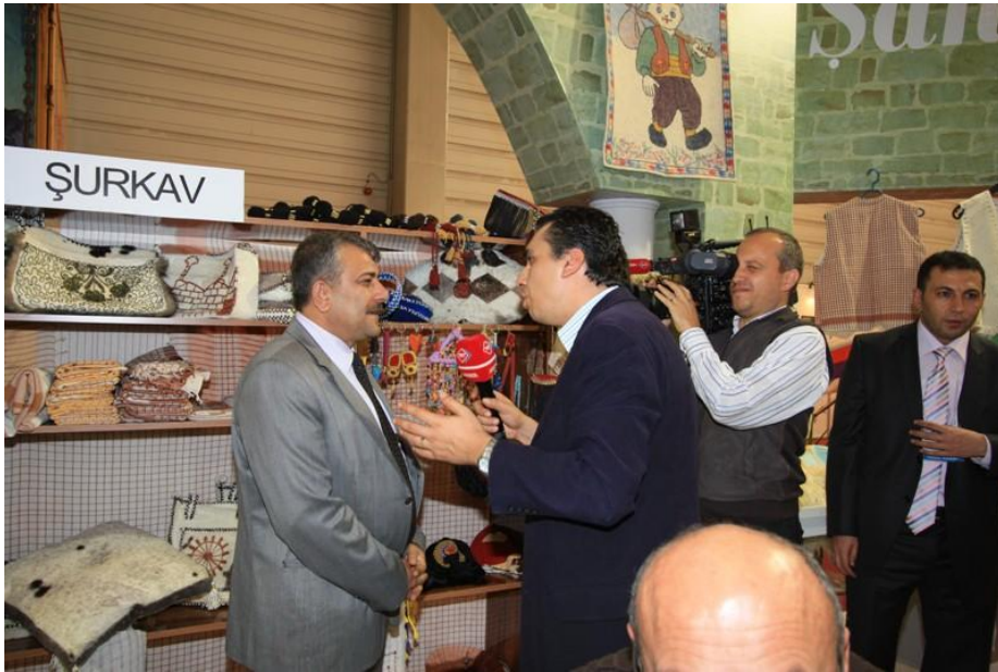
TRT Haber Röportajı