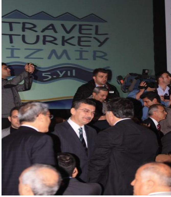
Şanlıurfa Valimiz Sayın Celalettin GÜVENÇ Açılış Töreninde