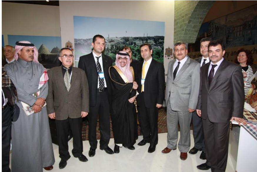
Arap Turizm Örgütü Birlik Başkanı ve Suudi Arabistan Prensi Bandar Fahad Al Fihait 'in Şanlıurfa Standı Ziyareti