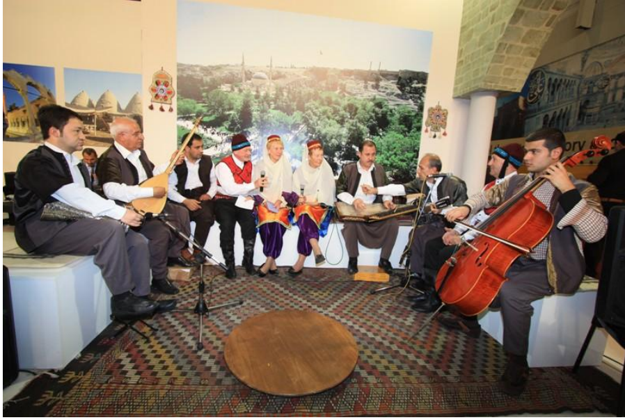
İngiliz Asıllı Ölüdeniz Yarenler Grubu Sıra Gecesi Ekibiyle