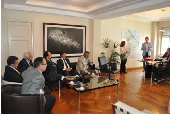
Resim 10: Buenos Aires Şehir Hükümeti Yatırımcı Hizmetleri Merkezi Ziyareti