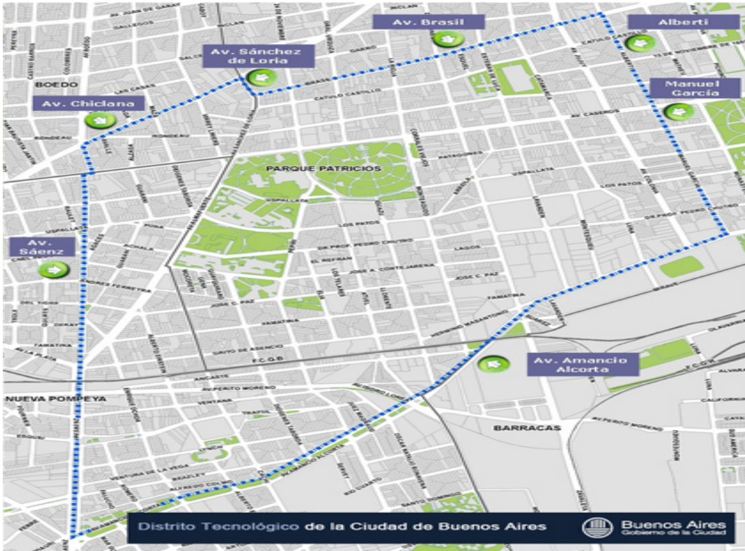
Resim 9: Teknoloji Bölgesi Planı

Son yıllarda, yeni bilgi ve iletişim teknolojileri alanında katma değer üreten şirketlere ev sahipliği yapan kentsel projeler beş kıtada farklı şehirlerde ortaya çıkmıştır.