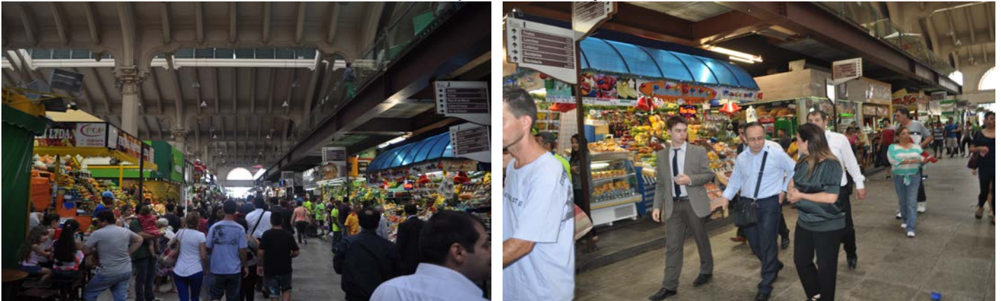
Resim 2: Şehir Pazarı Ziyareti

Karacadağ Kalkınma Ajansı Heyeti Sao Paulo Ticaret Ataşelerimizin eşliğinde Sao Paulo Şehir Pazarını (Mercado Municipal) gezerek incelemelerde bulunmuştur.