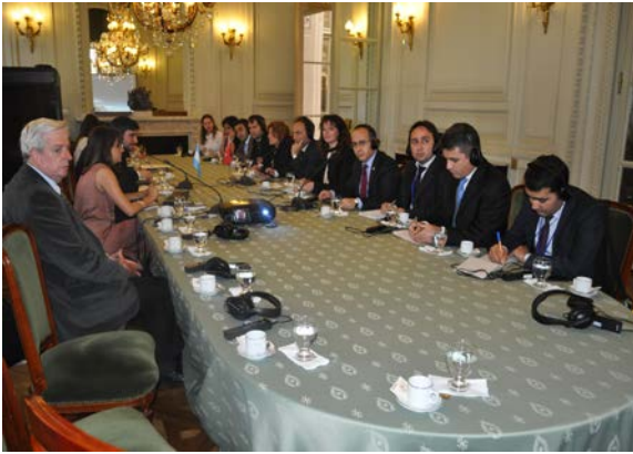
Resim 13: Dışişleri Bakanlığı Ziyareti