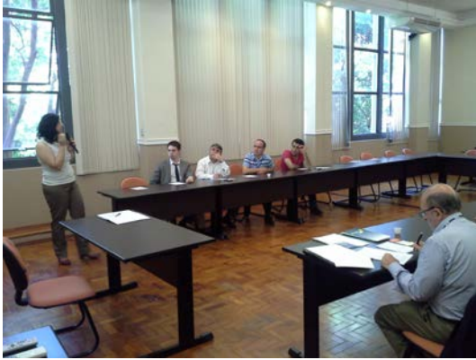
Resim 6: Sao Paulo Tarım Enstitüsü Ziyareti