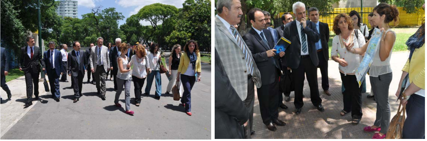
Resim 10: Teknoloji Bölgesi Ziyareti

Teknoloji Bölgesi, Parque Patricios ilçe merkezine yalnızca 15 dk mesafededir. Boedo ve kuzeyde Nueva Pompeya ilçesine kadar uzanan 200 hektarlık bir alanı kapsamaktadır.