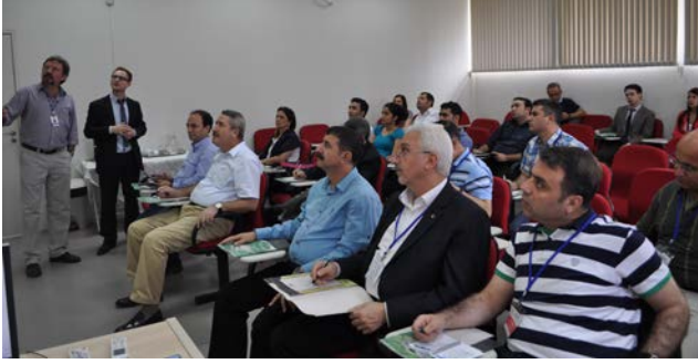
Resim 4: EMBRAPA Ziyareti

ilişkinin nasıl kurulabileceğine yönelik olarak da çeşitli araştırmalar yaptıkları belirtilmiştir.