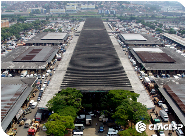
Resim 1: Sao Paulo Hali Ziyareti

Ajans Heyeti, Sao Paulo'daki ziyaretlerinin ilkini Sao Paulo Haline gerçekleştirmiştir. Sao Paulo Ticari Ataşelerimizin rehberliğinde gerçekleştirilen gezide antrepolar ve satış merkezleri yerinde incelenmiştir.