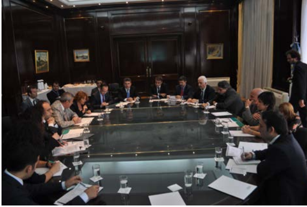
Resim 12: Sanayi Bakanlığı Ziyareti

Ajans Heyeti tarafından da, TRC2 Bölgesi ve yatırım fırsatları, kalkınma ajansları ve destek mekanizmaları ile Türkiye’deki girişimci ve yatırımcılara yönelik diğer kurumlar tarafından sağlanan destek ve teşvikler hakkında bilgi verilmiştir.