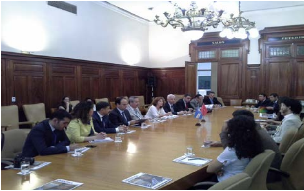
Resim 11: Sanayiciler Birliği Ziyareti