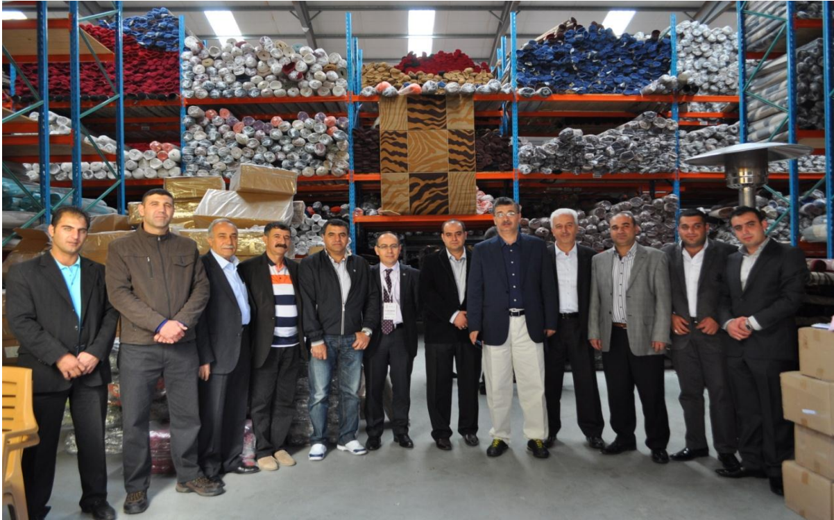
Resim 4: Mafy Carpet Firma Ziyareti

MAFY Carpet, Gaziantep Organize Sanayi Bölgesinde yerleşik, Polypropylene makine halısı ve halı ipliği üretimi yapan 30 yıla yakın geçmişe sahip bir firmadır. Gaziantep’de üretilmekte olan halıların GAC’a ihracatını yapan ve bu ürünleri GAC, Mozambik ve Angola’da kurduğu benzer depolar üzerinden bu ülkelere ve diğer komşu ülkelere satan firma, yakın bir zamanda kurulmuş olmasına rağmen hızlı bir büyüme seyri izlemiştir. Firma yetkilileri ile birlikte yapılan Johannesburg deposu ziyaretinde, firmanın iş yapma kapasitesinin oldukça yüksek ve geniş bir pazara sahip olduğu görülmüştür. Firma yetkililerinin GAC’daki çalışma ortamı konusunda en çok şikayet ettikleri konuların başında "güvenlik sorunu" gelmektedir.