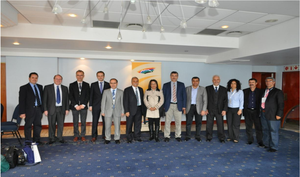
Resim 11: Cape Town Turizm Bakanlığı ve Cape Town Belediye Başkanı Patricia de Lille Ziyareti (1)

Cape Town Radisson Hotel'de kahvaltı eşliğinde gerçekleştirilen görüşme programı aşağıdaki şekilde olmuştur: