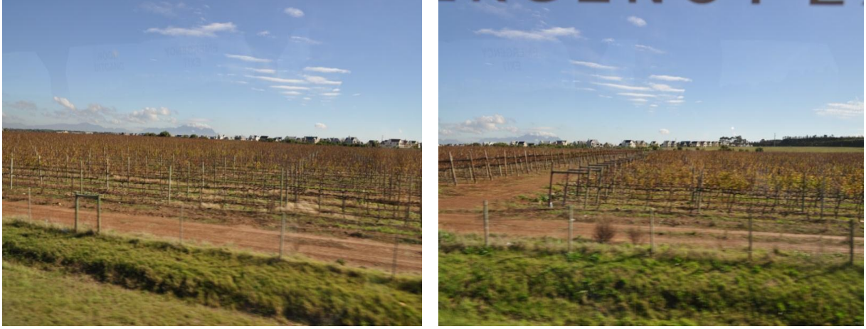
Resim 10: Stellenbosch Kasabası Ziyareti

Kasaba, Cape Kolonisi Valisi Simon van der Stel tarafından 1679 yılında kurulmuştur. Kasaba hızla gelişmiş ve 1682'de bağımsız bir yerel yönetim haline gelmiştir.