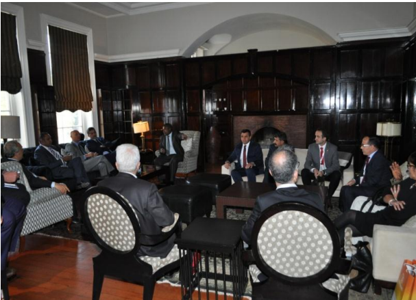
Resim 3: Gauteng Ekonomik Kalkınma Bakanlığı Ziyareti