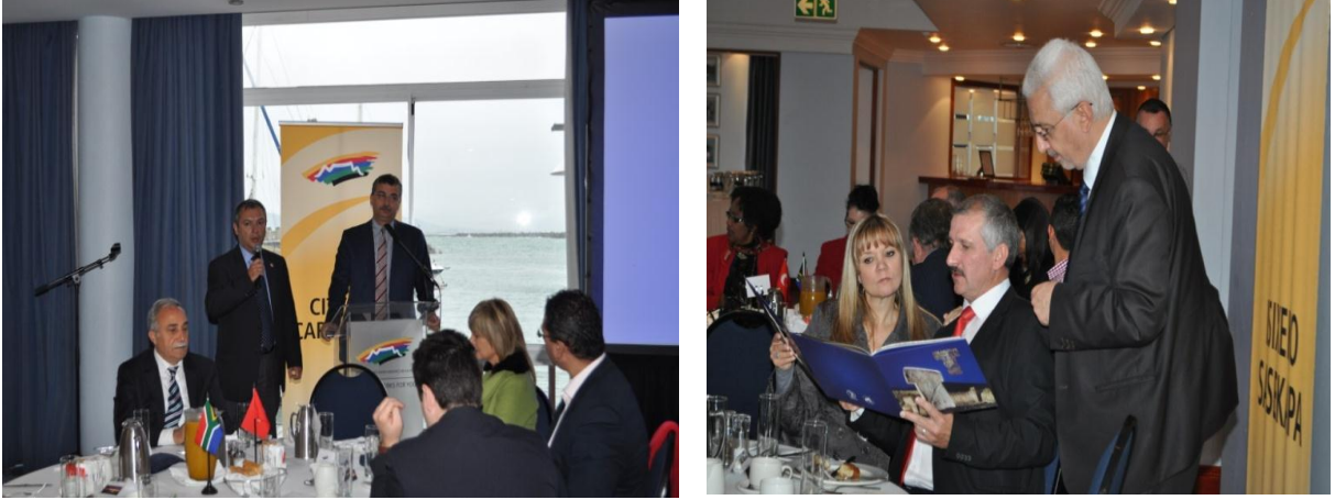
Resim 12: Cape Town Turizm Bakanlığı ve Cape Town Belediye Başkanı Patricia de Lille Ziyareti (2)