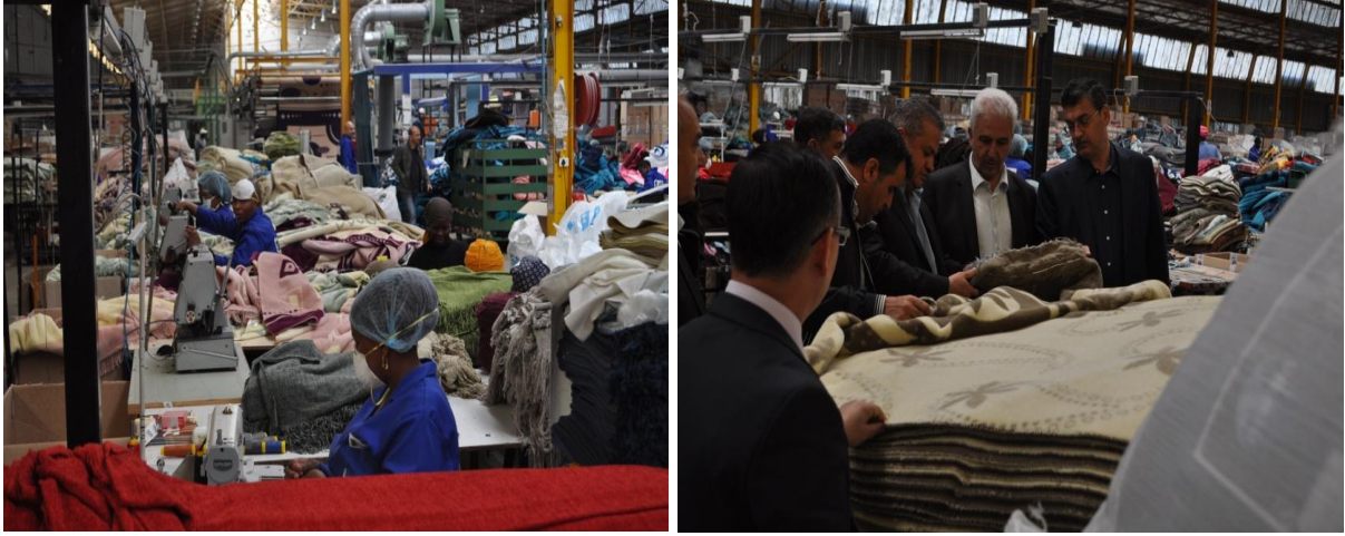
Resim 5: Sesli Tekstil Fabrika Ziyareti

zamanlarda yaşanan elektrik kesintilerinin en büyük sorunların başında geldiği ifade edilmiştir.