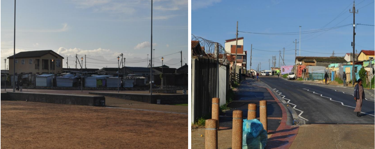
Resim 8: Saha Ziyareti (1)

Ayrıca, semt içerisinde alt-halk merkezleri planlanıp inşa edilmiştir. Bu merkezlerde, iş imkânı sağlayan dükkan veya mağazaların yanı sıra umuma açık genel amaçlı merkezler ile okullar bulunmaktadır. Buralarda ayrıca spor ve rekreasyon imkanları da yaratılmıştır. Semt sakinleri, mahallerinin iyileştirilmesinde yer almaktadırlar. Sokak ışıkları gibi mahallenin genel durumunun iyileştirilmesi için bir sosyal kalkınma fonu kullanılmıştır. Bu mahallerde, düzenli sosyal ve kültürel etkinlikler