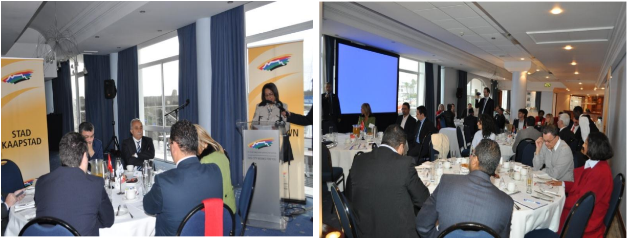
Resim 13: Cape Town Turizm Bakanlığı ve Cape Town Belediye Başkanı Patricia de Lille Ziyareti (3)

Son dönemde yoğun bir şekilde Türk işadamları heyetleri ile görüşmeler yaptığını ve Türkiye’de İstanbul ve İzmir’i ziyaret ettiğini belirten Cape Town Belediye Başkanı Patricia de Lille ise, Türkiye’nin Güney Afrika’nın yeni pazarlara açılması için önemli fırsatlar sunduğunu söyledi. Türkiye’de incelemelerde bulduklarını vurgulayan Lille, “Neredeyse her gün bir Türk işadamı heyeti ile görüşüyorum. Türkiye’nin bize katacağı, bizim de Türkiye’ye katacağımız çok şeyin bulunduğunu düşünüyoruz. İşbirliği yaparak birlikte kazanabiliriz. Altyapımızı güçlendirmek amacıyla kurumlarımızı tekrardan düzenledik, artık belediye bünyesinde bulunan ajansımızın yardımıyla yatırımcıların tüm sorunlarını tek çatı altında çözüyoruz. Tarım ve turizm, Cape Town ekonomisi için çok önemli. Bu konuda Diyarbakır ve Şanlıurfa ile işbirliği yapmaya hazırız. Deneyimlerimizi paylaşarak, kültürler arası diyalogumuzu geliştirerek birlikte kazanabiliriz” dedi.